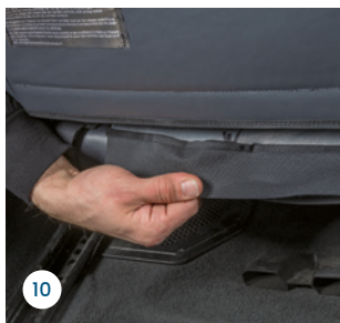
Sitzkissen | Coussin de siège