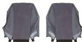
Lehne | Dossier